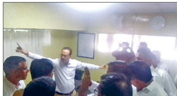
नारनौल। आपस में हंगामा करते रोडवेज कर्मचारी।