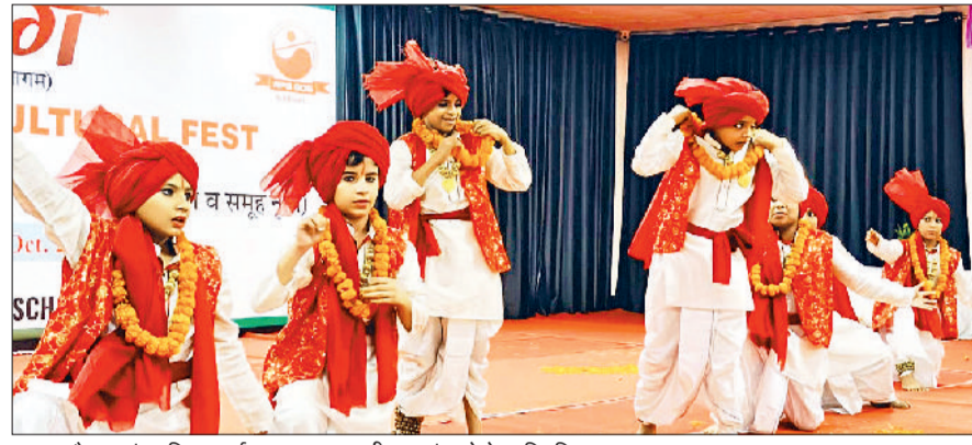
4 नारनौल। सांस्कृतिक कार्यक्रम प्रस्तुत करती छात्राएं।