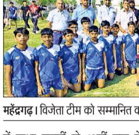
महेंद्रगढ़। विजेता टीम को सम्मानित करते हुए।

में कक्षा दसवीं से 12वीं तक के खिलाड़ी व लड़कियों का एक ही आयु वर्ग कक्षा छह से 12वीं तक रहा। मैदान पर खिलाड़ियों ने शानदार प्रदर्शन किया। खिलाड़ियों ने खेलों में उत्कृष्ट प्रदर्शन किया। दर्शकों ने खिलाड़ियों का हौसला बढ़ाया और खेल वातावरण उत्साह और उमंग से भर गया। खो-खो प्रतियोगिता में जूनियर लड़कों की टीम में यदुवंशी महेंद्रगढ़ प्रथम, यदुवंशी नारनौल द्वितीय, यदुवंशी रेवाड़ी तीसरे स्थान पर रहे, सीनियर वर्ग में यदुवंशी महेंद्रगढ़ प्रथम, यदुवंशी नारनौल द्वितीय, यदुवंशी मदेला तृतीय स्थान पर रहा, वहीं