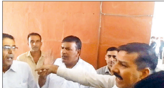
नारनौल। आपस में हंगामा करते रोडवेज कर्मचारी।

बस स्टैंड पर सोमवार को जीएम कार्यालय में दो पक्षों में बंटे कर्मचारी आपस में उलझ गए। हंगामा बढ़ते देख जीएम ने दोनों पक्षों को समझाकर मामला शांत करवाया। इस मामले की शुरुआत जीएम द्वारा चालक को सस्पेंड करने से हुई थी। इसी मामले को लेकर चालक महासंघ की राज्य कमेटी के सदस्य जीएम से मिलने आए। जहां पर रोडवेज कर्मचारियों के दो पक्षों में जीएम के सामने ही हंगामा हो गया। मामला बढ़ता देख जीएम ने दोनों पक्षों को समझाकर हंगामा शांत कराया। वहीं, बस स्टैंड पर हंगामा की सूचना मिलने पर पुलिस भी मौके पर पहुंची।