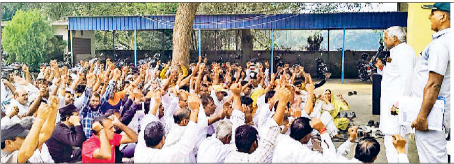
महेंद्रगढ़। कर्मचारियों को संबोधित करते यूनियन के पदाधिकारी।