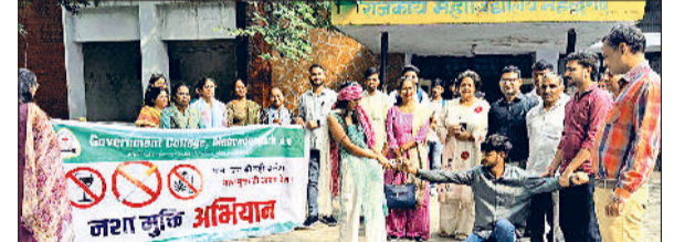
महेंद्रगढ़। नशे के विरुद्ध नुकड़ नाटक प्रस्तुत करते हुए।