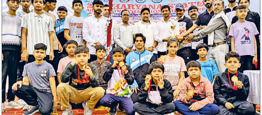
नारनौल। समापन पर पदक विजेताओं को सम्मानित करते हुए।

आंदोलन को तेज किया जाएगा। जिसमें महेंद्रगढ़ शहर की जल व मूल व्यवस्था को बंद करने के लिए संगठन को मजबूर होना पड़ सकता है। जिसकी तमाम जिम्मेवारी कार्यकारी अभियंता व तीनों उप मंडल अभियंताओं की होगी।