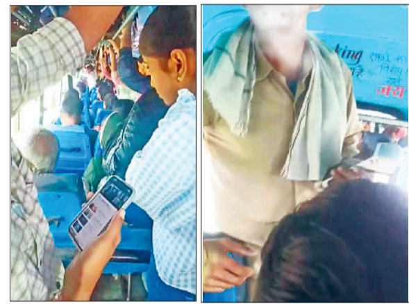
नारनौल। विद्यार्थियों से बहसबाजी करता परिचालक और रोडवेज बस में यू रहती है विद्यार्थियों की भीड़।

रोडवेज विभाग ने सेंट्रल यूनिवर्सिटी में पढ़ने वाले विद्यार्थियों को बस पास जारी तो कर दिए, लेकिन इसके बावजूद इन बस पास का वजुद दादरी-नारनौल रूट पर चलने वाली रोडवेज बस के चालक-परिचालक मानने को तैयार नहीं हैं। जब ऐसी स्थिति बनी तो अधिकारियों ने स्पेशल आदेश जारी किए कि इस रूट पर आवागमन करने वाली सभी रोडवेज बस सेंट्रल यूनिवर्सिटी के मुख्य द्वार पर रोकी जाएगी। हैरानी की बात है कि दूसरे जिले के अधिकतर चालक-परिचालक अपने ही महकमे के इन अधिकारियों के आदेश तक मानने को तैयार नहीं हैं। नतीजतन, इनकी इस हठधर्मिता का हार्जाना विद्यार्थियों को यूनिवर्सिटी में लेटलतीफ़ी के रूप में भुगतना पड़ रहा है। यहीं नहीं, इस मुद्दे पर आए दिन रोडवेज बस के चालक-परिचालकों से विद्यार्थियों की बहसबाजी भी हो रही है।