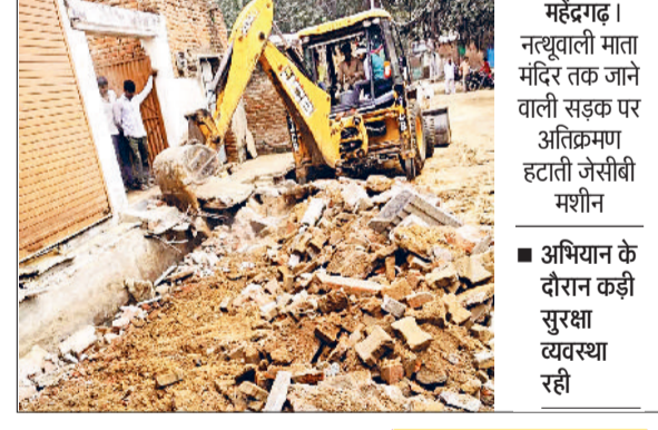
महेंद्रगढ़। नत्थूवाली माता मंदिर तक जाने वाली सड़क पर अतिक्रमण हटाने की शुरुआत।