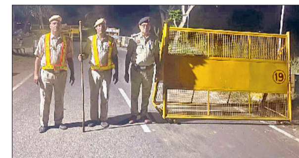
नारनौल। नाके पर तेनात पुलिसकर्मियों।

इस व्यापक अभियान के तहत जिले के प्रमुख मार्गों व विभिन्न